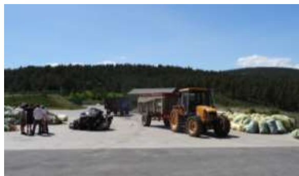
Le Massegros, Collecte 2017

La mise en place sur la déchèterie d'un système de consigne est à nouveau demandée pour les saches ADIVALOR : les agriculteurs se fourniraient en saches vides sur place et les ramèneraient remplies lors des collectes organisées par le COPAGE.