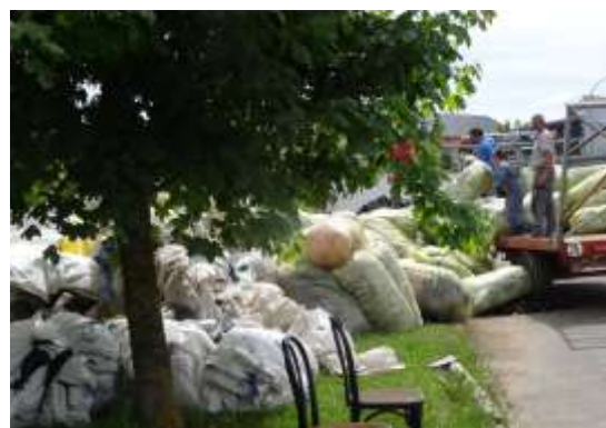
Mende, Collecte 2017