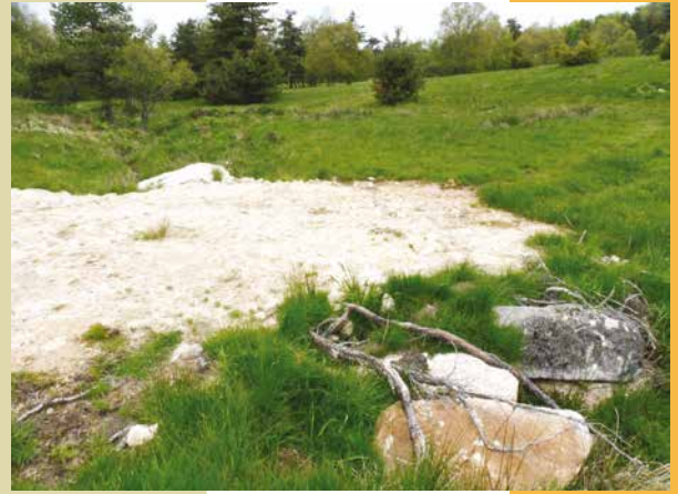
Aménagement pour passage des animaux

Votre projet ne figure pas dans la liste ? Contactez la Communauté de Communes Terres d'Apcher Margeride Aubrac ou la structure animatrice du site Natura 2000, le COPAGE pour qu'on puisse l'étudier (contacts en p4.)