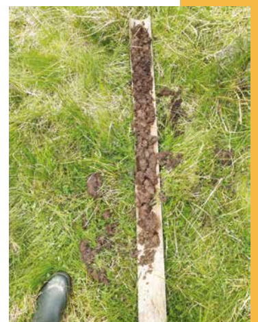
Sondage de la parcelle