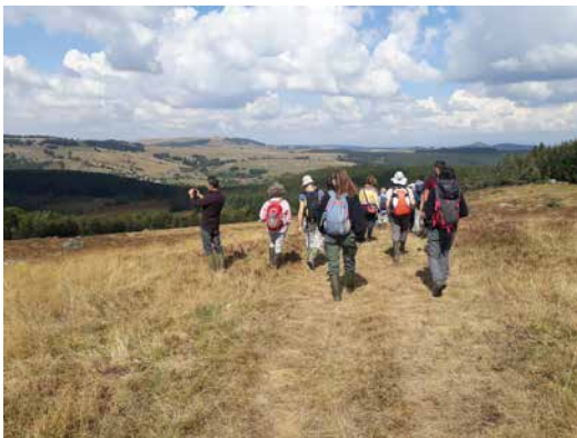
Groupe d'études Tourbières

Dans le cadre de l'animation du site Natura 2000, le COPAGE contribue à la mise en place de veilles environnementales et apporte un conseil préalable à la réalisation d'évaluation d'incidences aux porteurs de projets (trails, courses motorisées, travaux forestier, etc.). Des suivis d'espèces et d'habitats sont également menés annuellement pour observer leur évolution.