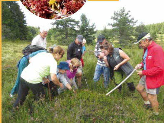
Zone humide observée