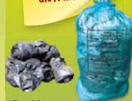
ficelée en sache*

Conditionner le film polyamide dans les sacs bleus fournis par votre distributeur