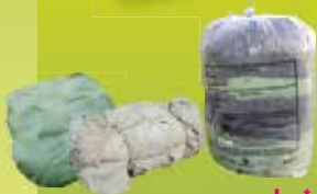
en boule ou en paquet ficelé