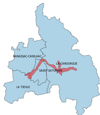
Carte du site «Vallon de l'Urugne»