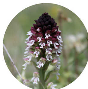
Ophrys de la passion - Orchis pourpre - Orchis homme pense - Orchis singe - Orchis brûlé - Ophrys d'Aymonin - Orchis brûlée