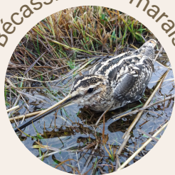
Bécassine des marais

Parties dégagées avec une végétation basse , qui n'excède pas les 15 cm.